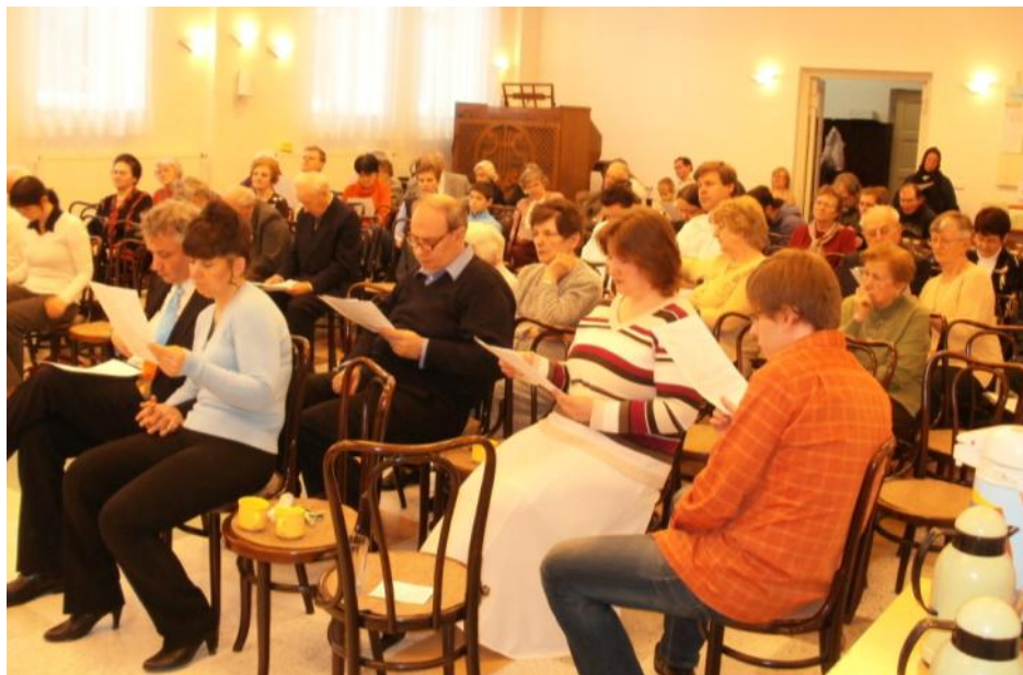
Výroční sborové shromáždění, 27.3.2011